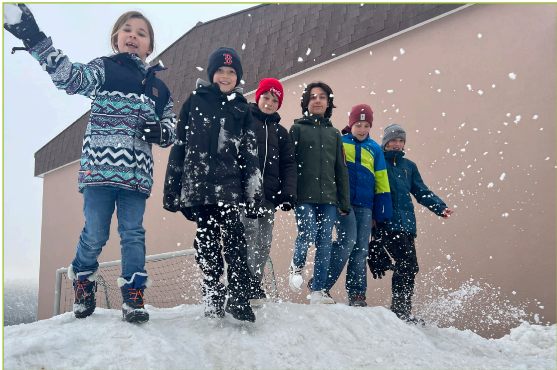
Unser motiviertes Redaktionsteam.